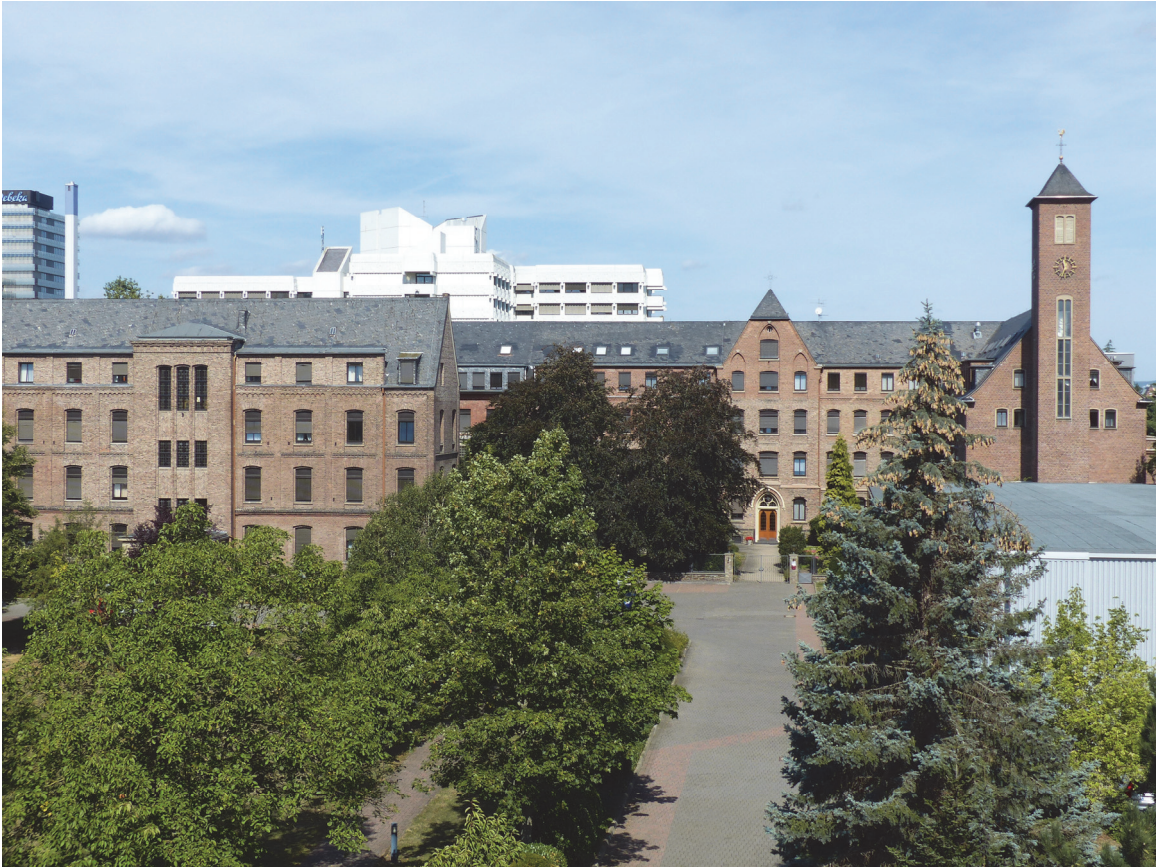
Mutterhaus Marienhof, Koblenz