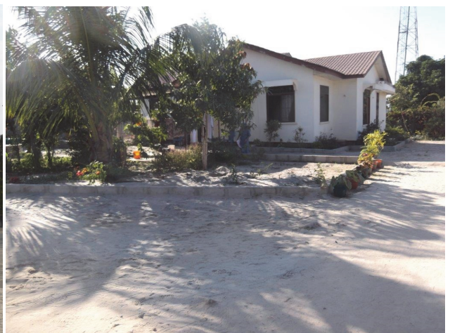
Haus in Tansania, Afrika