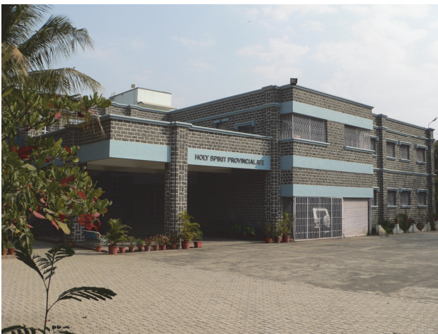
Provinzhaus Pune, Indien